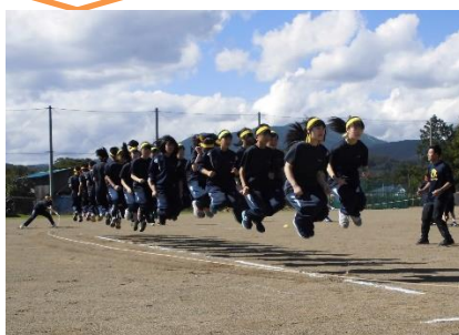
大縄跳び みんなの心と声がLINK