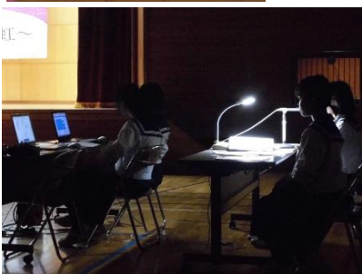
閉祭式の成行きを見守る本部役員席