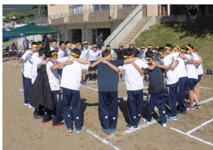
円陣を組んで一致団結（ミニ運動会）