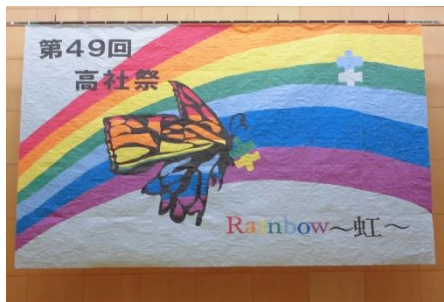
開祭式 ステージバックの披露

今年も高社祭「地域展」への展示作品の出品、ありがとうございました。趣向を凝らした様々な作品により、光彩を添えていただきました。感謝申し上げます。