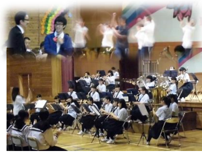
吹奏楽部 コナンやダンスとコラボ