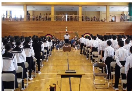
合唱コンクール（全クラス金賞）おとりは「ふるさと」