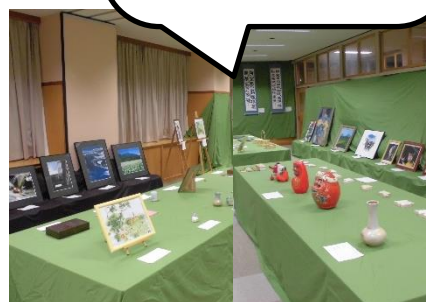
色とりどりの地域展